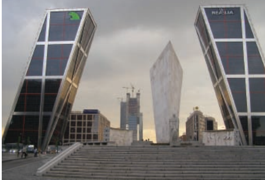
Casa de Baños / Közfürdő (Carmen Gil Torres)

Négy fő rendezvénykategória van, ezeknek