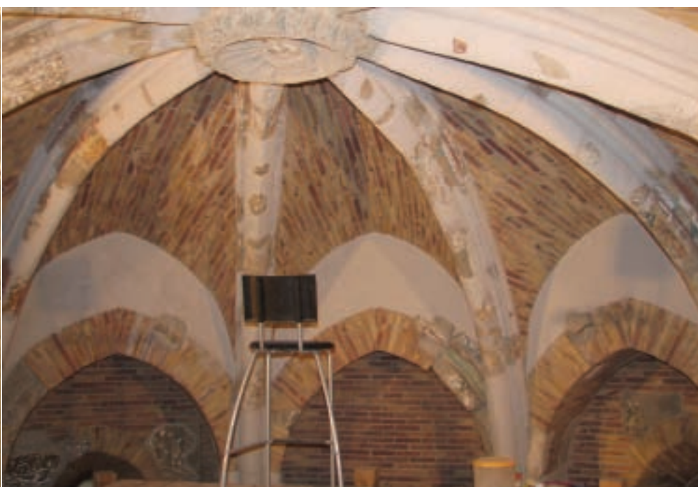
A restaurátor széke...