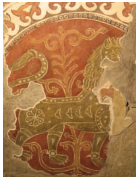
Az oroszlános falkép

A feltárás, a képet károsító fedőrétegek eltávolítása mikromilliméterről mikromilliméterre halad. Az előkerült stílárís jegyek, a festményt előkészítő karcolt rajzváltozatok, a festék és rétegei anyagának labora-