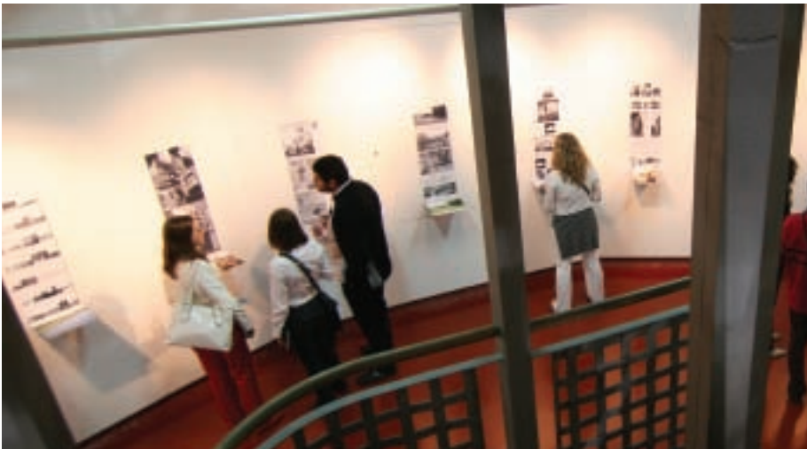
A fiatalok feketén fehérén kiállítás a Siloban