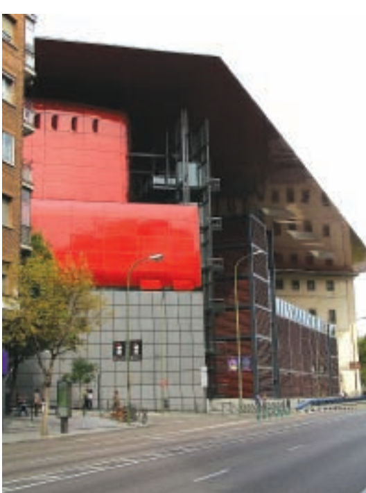
A Centro de Arte Reina Sofia új épülete (Jean Nouvel)