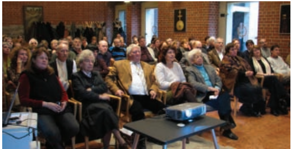
A konferencia résztvevői

E jeles helyszín ma még a nagyközönség számára nincs megnyitva, hiszen munkaterület, a konferencia résztvevői vezetéssel