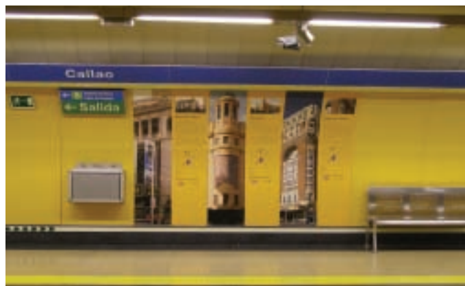
A COAM épületismertetője egy metróállomáson