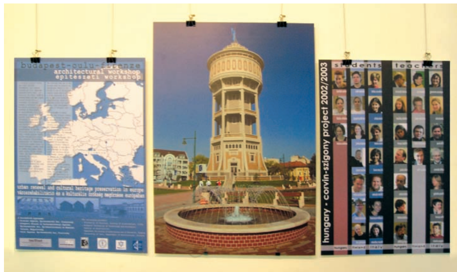
A „DENKMAL 2006” alkalmából készült vándorkiállítás bemutatása az Építész Ház Kós-termében