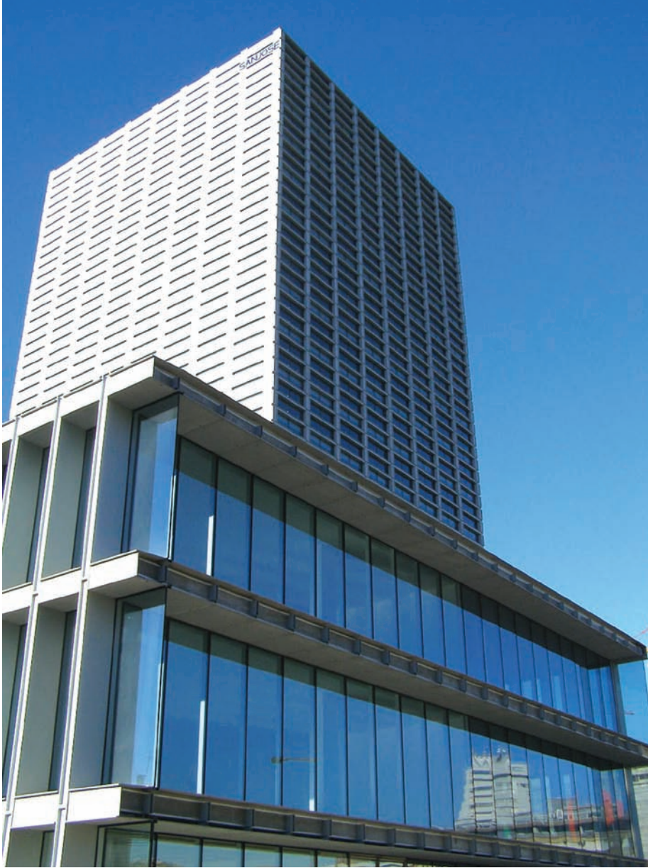
Burgo Tower (Souto Moura)

hogy eközben mindig a minőségre, az építészet felelősségére, az életminőséget meghatározó jelentőségére koncentráljunk.