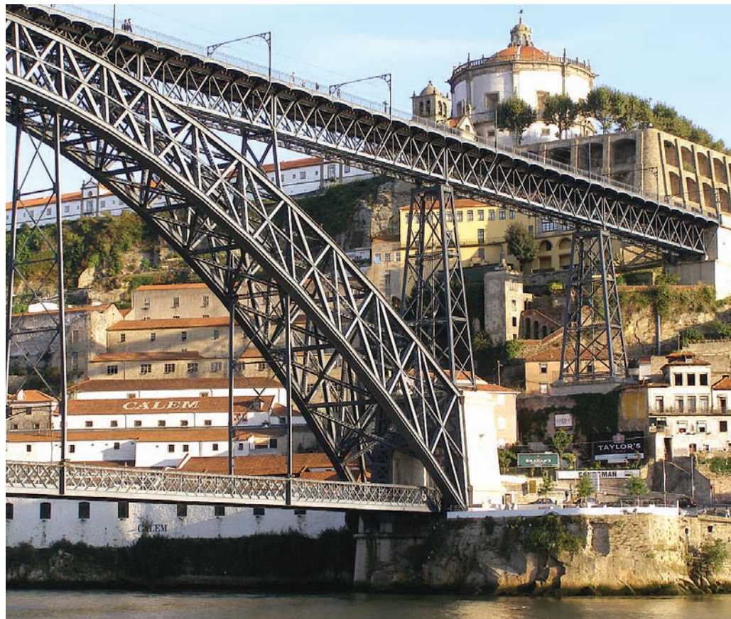
Az Eiffel irodában tervezett kétszintes híd

A balti államok hangsúlyosan kérték az EFAP támogatását a jelenleg készített építészeti politikájukhoz. Ekkor Rob Docter megjegyezte, s ez számunkra is megszívlelendő jó tanács, hogy nagyon fontos, hogy a politikával együtt beépítsék azokat a mechanizmusokat is, amelyek a politika megvalósítását, végrehajtását biztosítják. Ezt a jól szervezett Hollandia szinte rögtön meglépte a különböző szervezetek megalapításának a politikában való meghatározásával (Berlage Institut, Netherlands Architecture Insitut, Architecture Fund, stb.). Rob megjegyezte, hogy a skótok utólag, de szintén felállították azt a szervezetet, amely a politika érvényesítéséhez kell. Ez a szervezet az Architecture+Design Scotland (A+DS), melynek részletes ismertetését a Kamarai Közlöny 2005. december–2006. januári számában közzé tettük.