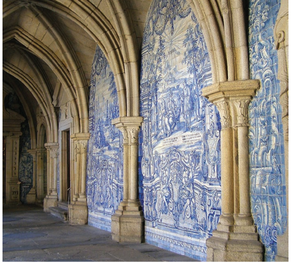
A katedrális melletti rendház kerengője

egészen kivételes érzetet és térélményeket nyújt, és alkalmazva van a portugál építészetre jellemző színes kerámiaburkolat is – izgalmas és újszerű felfogásban. Újdonság az is, hogy a nagy koncertterem „szinpadának” végfala üveg, ami előtt szintén, ezúttal színezett panelekkel készült üveggel képez háttérrel a muzikusok mögé, amelyen napközben átsüt a nap. A kis koncertteremnek meg a közlekedő felé eső fala üveg, amelyen keresztül az épp arra járó betekinthez a koncertre, vagy az ott folyó próbára. Sokhelyütt hullámos üveggel határolja a tereket, kifelé is, több emelet magasságban, ami izgalmas játékra csábította az ott szaladgáló gyerekeket. Elgondoltam, hogy azok az iskolások esetleg azokból az egykor gazdag, választékos kialakítású, de ma szinte rothadó belvárosi házakból kerültek ide; egy dúsgazdag király elvarázsolt kastélyába... Jól van ez így? Abból a pénzből, amiből ez a bőségesen megtervezett, de funkcióval igazán ki nem töltött épület-csoda megépült, épületsorokat, emberi életek sokaságát lehetett volna feljavítani, minőségivé tenni. Tudom, ezek nem mérhetők össze ilyen egyszerűen. Nem lesz népszerű a következő gondolat-sor, de mégsem hallgatom el, hogy azóta is bennem motoszkál, hogy hisz a Casa de Música nem helyi építész műve. Nem biztos, hogy eléggé beleélte magát annak az országnak a helyzetébe, ahová tervezett. Nem biztos, hogy igazán a helyi igé-