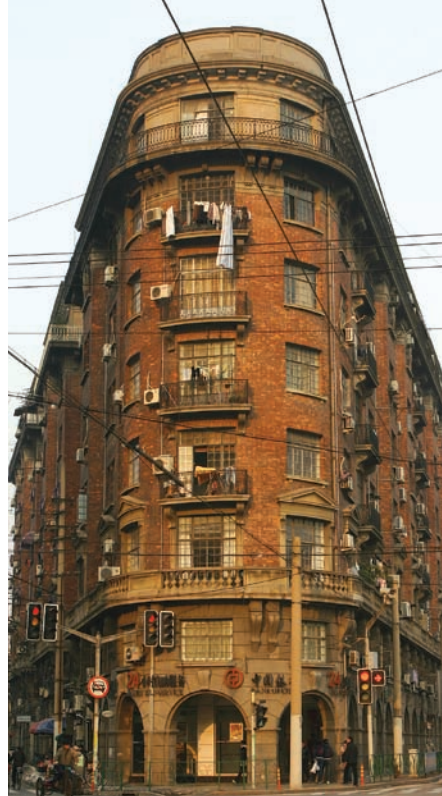
A Normandie Apartements