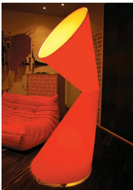
A Műcsarnok forgószínpadán bemutatkozott a közeljövő