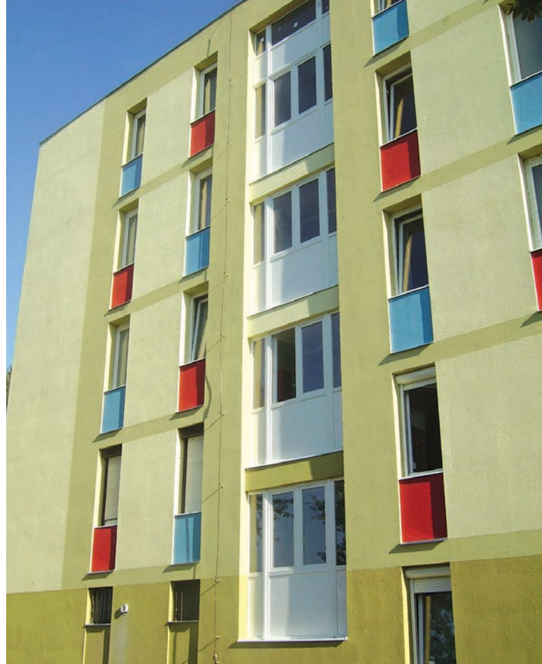
Tata, Bacsó B. utca