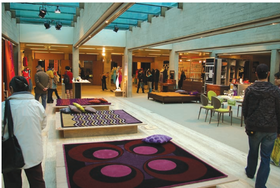
A „madeinhungary” a Gödörben