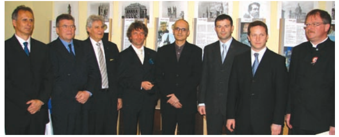
Ybl-díjasok és díjátadók

2008. március 13-án, csütörtökön került sor az Építészek Házában a 2008. évi Ybl-díjak ünnepélyes átadására. A díjakat dr. Újhelyi István úr, az Önkormányzati és Területfejlesztési Minisztérium államtitkára adta át.