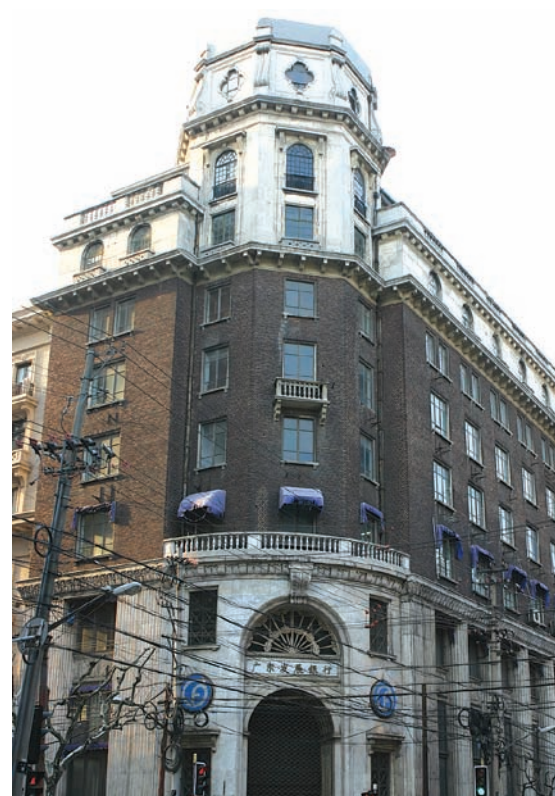
A Joint Savings Society épülete

Hospital" kórházba, vagy lift beépítése magánvillákba).