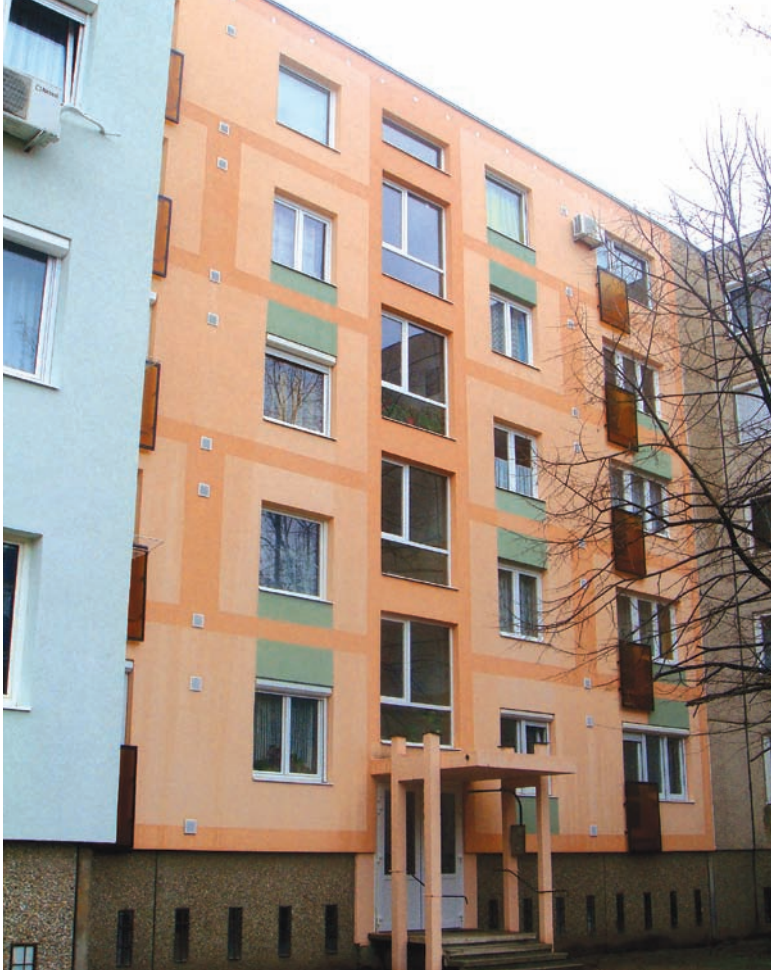
Komárom, Kelemen L. utca