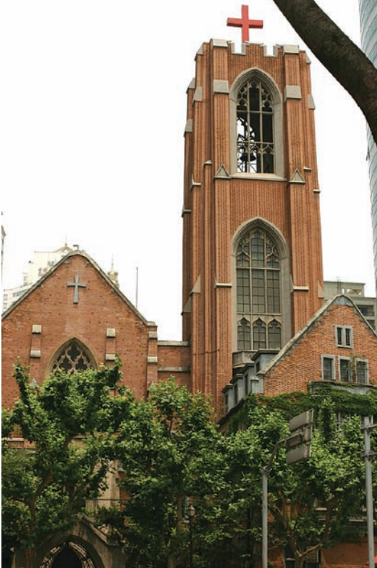
Moore Memorial Church