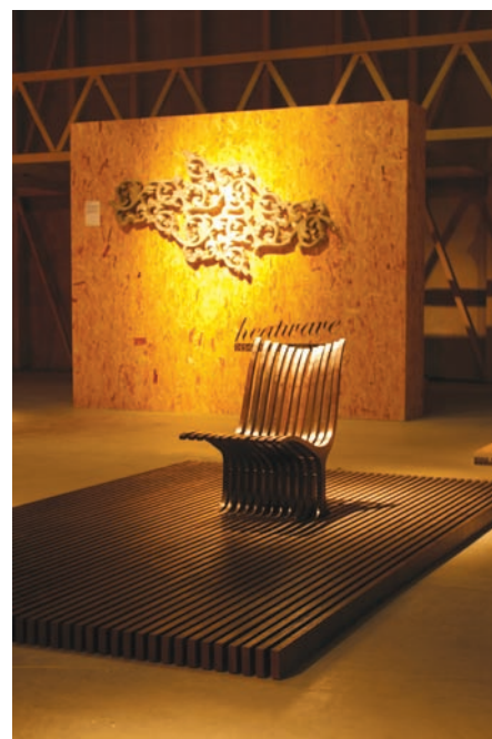
A Gödörben holland termékek is bemutatkoztak

felszereléseivel együtt, készen illeszthető egy adott épület belsejébe.