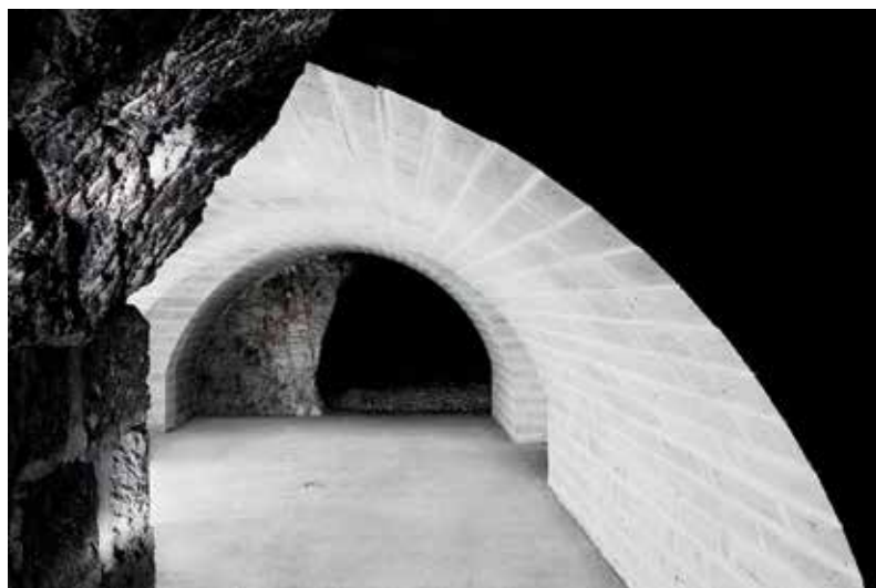
A két kilométer hosszú többszintes pincelabirintus felújított tere a HOLDVÖLGY Borászatban