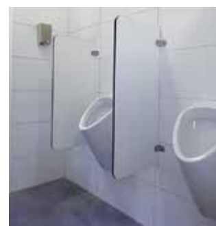
ES-PSV C10 pissoir paraván-fal