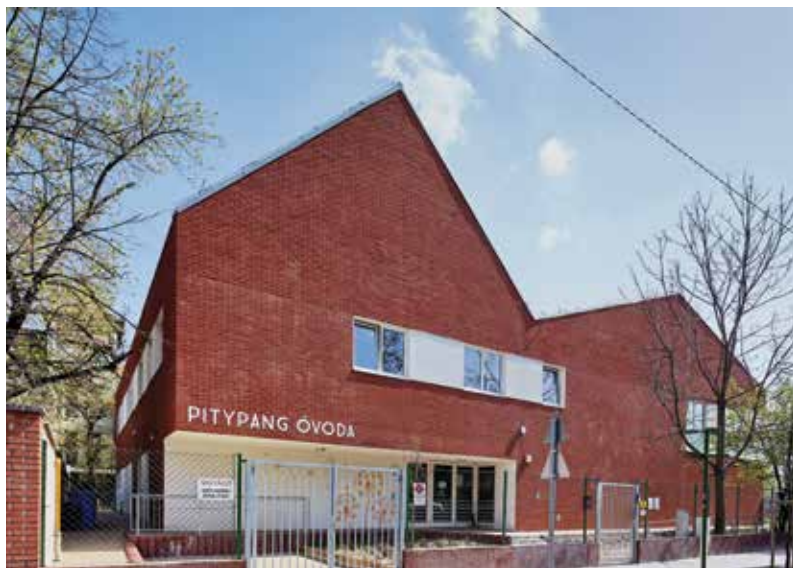
Pitypang Óvoda, Budapest, VIII. kerület

Az építészársadalomnak pedig egységet kell alkotnia, amely szakmai alapokon nyugszik, elismerve a kiemelkedő alkotók munkáját és nyitottan maradni a világra. Nem kell kompromisszumokat kötni a vizuális kultúra és a fenntarthatóság terén.