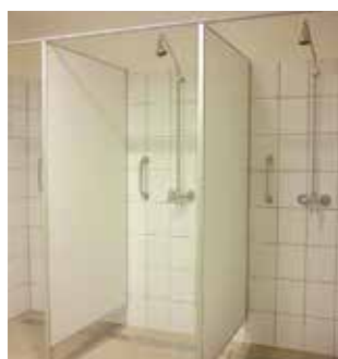
ES-SZV 28 zuhany válaszfal elem