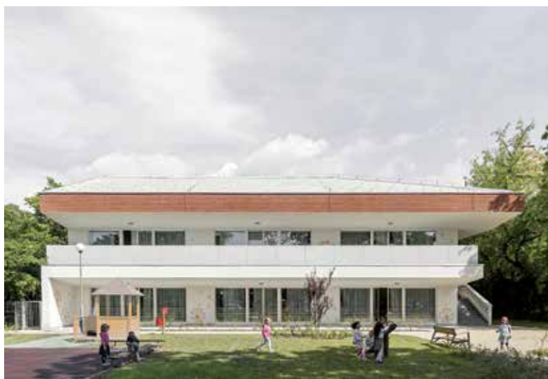
Pitypang Óvoda, Budapest, VIII. kerület

A borászatok, amiket terveztünk mind természetes táji környezetben épültek vagy vidéki környezetbe illeszkednek, ahol élnek és erősek a helyi épített hagyományok. A borász megbízóinknak nagyon erős a kötődése a helyhez, a természethez, a szőlőterek közelében élnek, a borkészítés az életük. Rajtuk keresztül és a táji környezet hatására mi is egyre jobban megismertük a szőlőtermesztést és a borkészítést, kicsit mi is ott élhettünk a borászat közelében, megérettük ennek