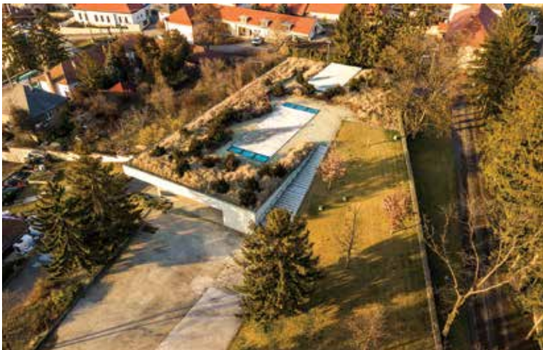
A HOLDVÖLGY Borászat tömege a lejtőre ékelve illeszkedik a védett településképhez

A HOLDVÖLGY stúdióknak legelső borászati projektje Mád településen belül, világörökségi területen épült meg. A kiemelten védett épített környezet miatt az épületet a lejtős domboldalra ékelve terveztük. A szabályosan szerkesztett egyszerű tömeg tiszta, semleges átmenetet képez a föld mélyén rejtőző két kilométer hosszú ősi pincelabirintus és a felszín felett kialakított csodás park között. Az épület múzeumi minőségű belső tereivel helyezi középpontba a borkészítés legkorszerűbb technológiáját.