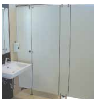
ES-SV C13 szerelt válaszfal rendszer