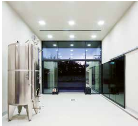
Üzemi bejárat a HOLDVÖLGY Borászatban

Az építésznek nem kell minden dologhoz értenie, de vajon Önök kedvelik-e a jó borokat? Ha igen, milyet?