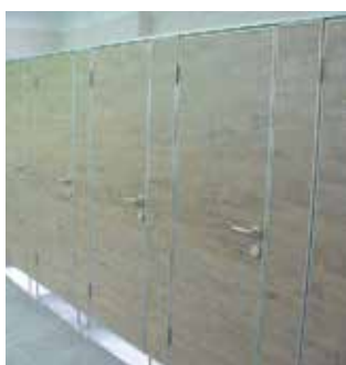
ES-SV 28 wc válaszfal rendszer